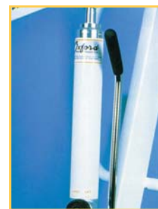
Particolare del pistone (versione idraulico)